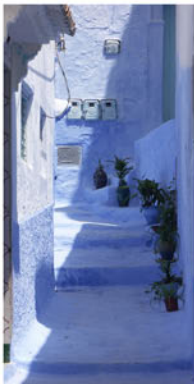
Chefchaouen - Morocco, founded in 1471 by Andalusian Moriscos and Jews

5151 CHEMIN DE LA COTE SAINTE CATHERINE MONTREAL QC H3W 1M6