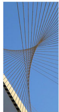
The Chords Bridge - Jerusalem 2008 (גשר המיתרים)

GELBER CENTRE 5151 CHEMIN DE LA COTE SAINTE CATHERINE MONTREAL QC H3W 1M6