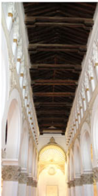
Synagogue Ibn Shushan - Toledo 1180 (Santa Maria la Blanca)

5151 CHEMIN DE LA COTE SAINTE CATHERINE MONTREAL QC H3W 1M6