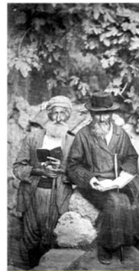
Old Yishuv - Eretz Israel 1881 (Sephardi Jews and Moustarabim)

7026 BATHURST STREET THORNHILL (TORONTO) ON L4J 8K3