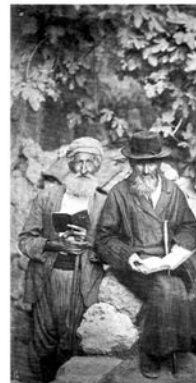
Old Yishuv - Eretz Israel 1881 (Sephardi Jews and Moustarabim)

LES CALE DUNDRO 669 AVENUE DES MÉSANGES SAINTE AGATHE DES MONTS QC J8C 2Z7